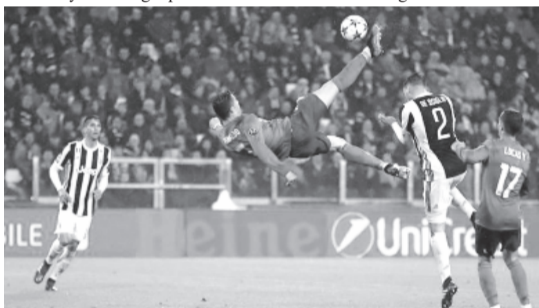
Cristiano Ronaldo gyönyörű ollózással duplázta meg a Real előnyét, a torinói stadion nézői pedig egy emberként tapsolták meg az emlékezetes találatot. „Minden Juventus-szurkolónak szeretnék köszönetet mondani. Ilyesmi nem történt velem eddigi karrierem során” – mondta a portugál futballista a mérkőzés után.

A hajrában már nem változott az eredmény, így a német csapat kedvező helyzetből várhatja a jövő szerdai visszavágót.