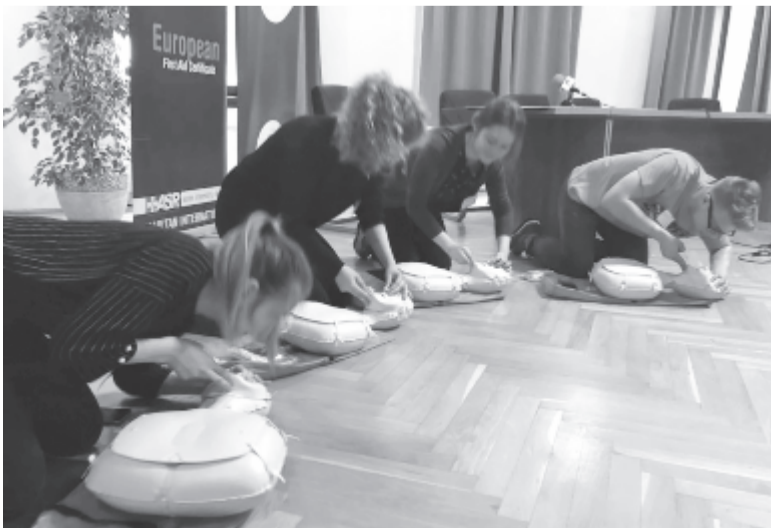
Bolyais diákok életmentő gyakorlati bemutatója

A marosvásárhelyi Samaritanus Mentőszolgálat tagja az Európai Bizottság nemzetközi tanúsítványával rendelkező, elsősegélynyújtást oktató szakembercsoportnak. A CE First Aid egy olyan állandó munkacsoport, amely a Nemzetközi Samaritanus Szövetség keretében orvosok és sürgősségi beavatkozásokra szakosodott szakemberek állandó képzését biztosítja, ugyanakkor kutatómunkát végez annak érdekében, hogy az európai uniós normáknak minden részt vevő ország csapata eleget tehessen, és az európai színvonalú minőségi életmentő oktatást népszerűsítsék a megfelelő körülmények megteremtésével.