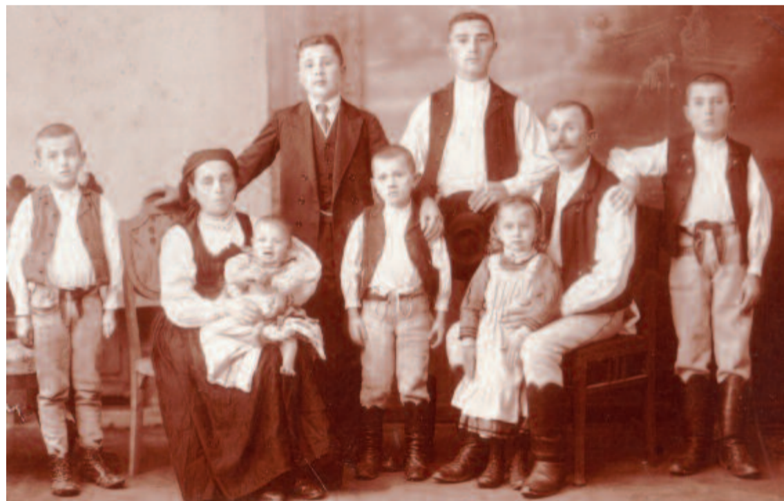
Családi kép a múlt század kezdetéről